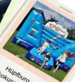
Hüpfburg und Schokokusswurfmaschine